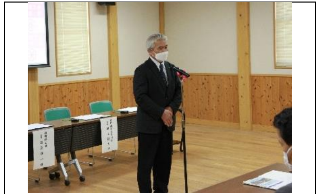
綾町商工会 日高会長