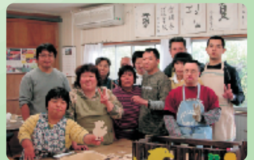
「すくすく工房」の皆さん。和気あいあいとした雰囲気にも和む