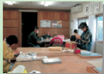
「すくすく工房」での仕事風景。働いているときの表情は真剣そのもの